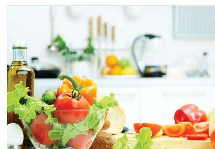
Mercado dos produtos de bem-estar e saúde