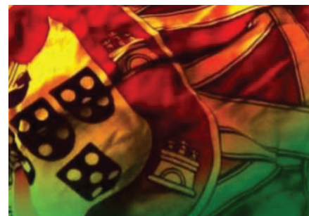
Mercado da saúde