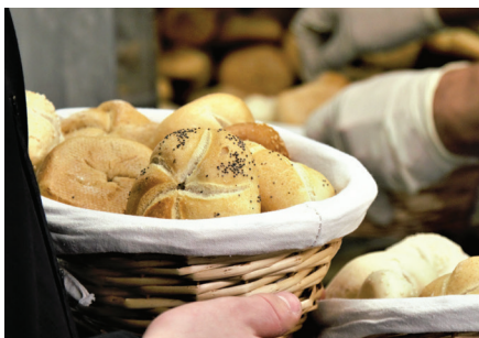
Mercado Gourmet / Premium