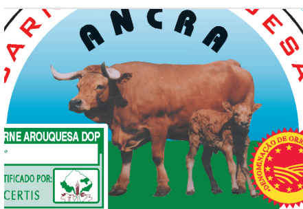
Mercado dos produtos certificados