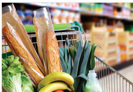
Mercado dos produtos de conveniência