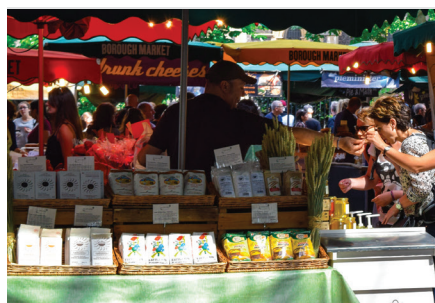
Mercado dos produtos endógenos e de origem local