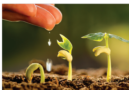
Mercado dos produtos ambientalmente e socialmente sustentáveis