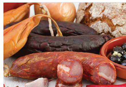
Mercado dos produtos transformados e conservados